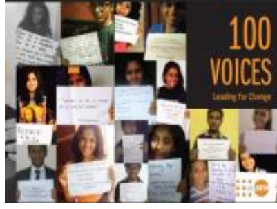
100 Voices Campaign Leading for Change (2015)