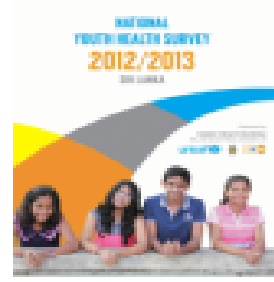
National Youth Health Survey 2012/2013 (2016)