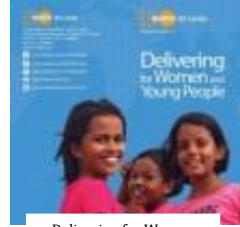
Delivering for Women and Young People (2014)