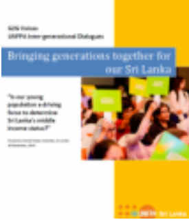
Generation to Generation Dialogue Available in Sinhala and Tamil (2015)