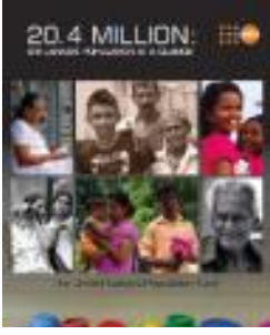
20.4 Million: Sri Lanka's Population at a glance (2015)