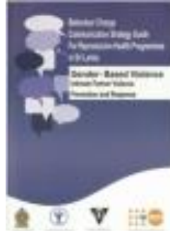
Behaviour Change Communication Strategy for Reproductive Health Programmes in Sri Lanka (2014)